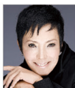
池畑慎之介 (ピーター)