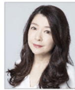
仲道郁代 *Kiyotaka Saito