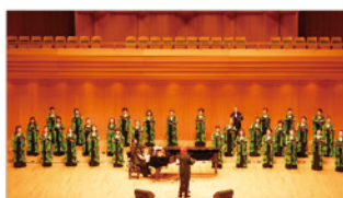
神楽坂女声合唱団