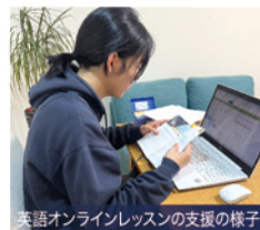
英語オンラインレッスンの支援の様子