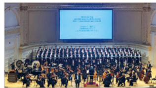
六本木男声合唱団ZIG-ZAG